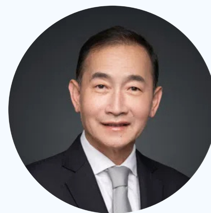
林学民教授 欧洲科学院外籍院士、IEEE Fellow 上海交通大学